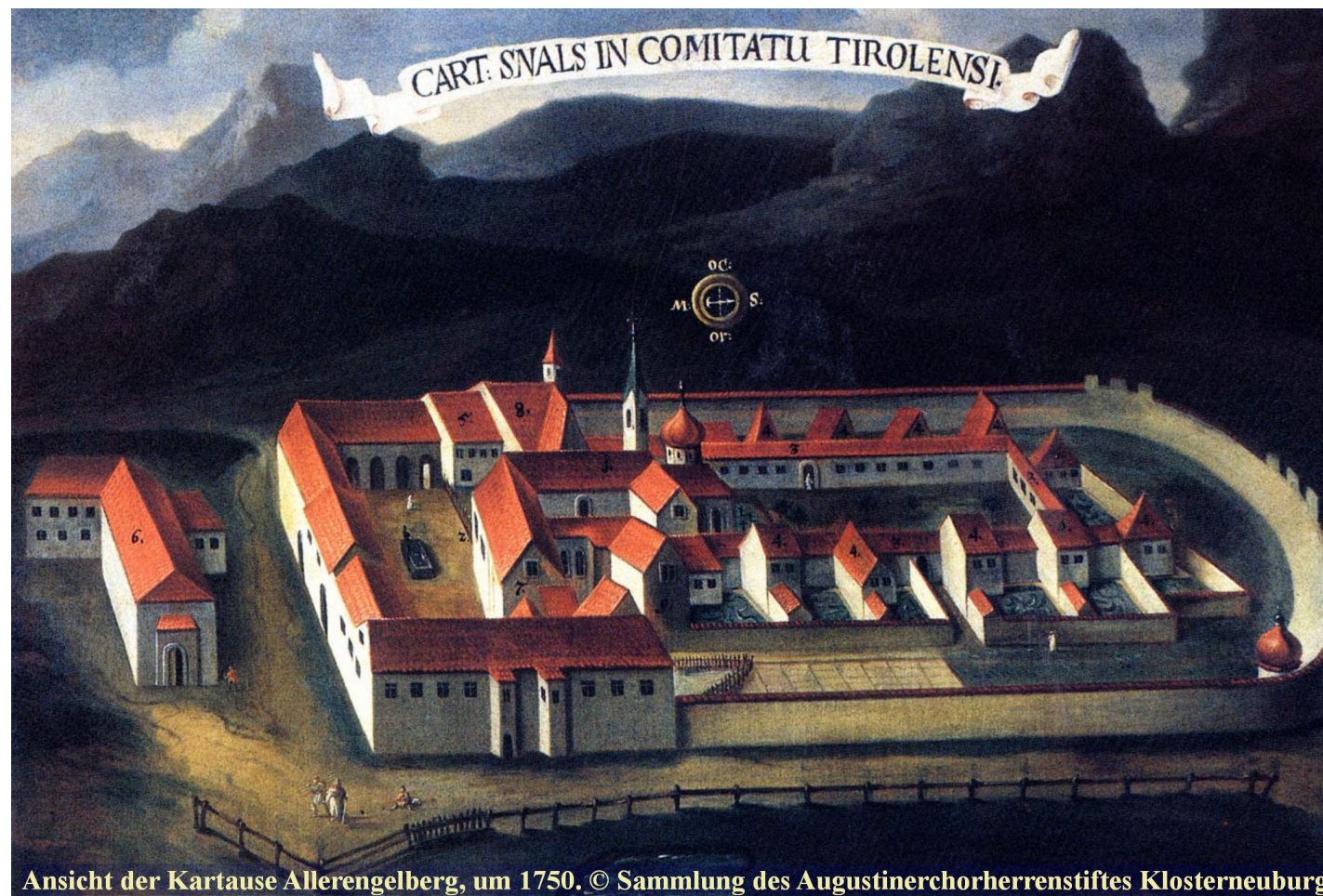
Ansicht der Kartause Allereengelberg, um 1750.