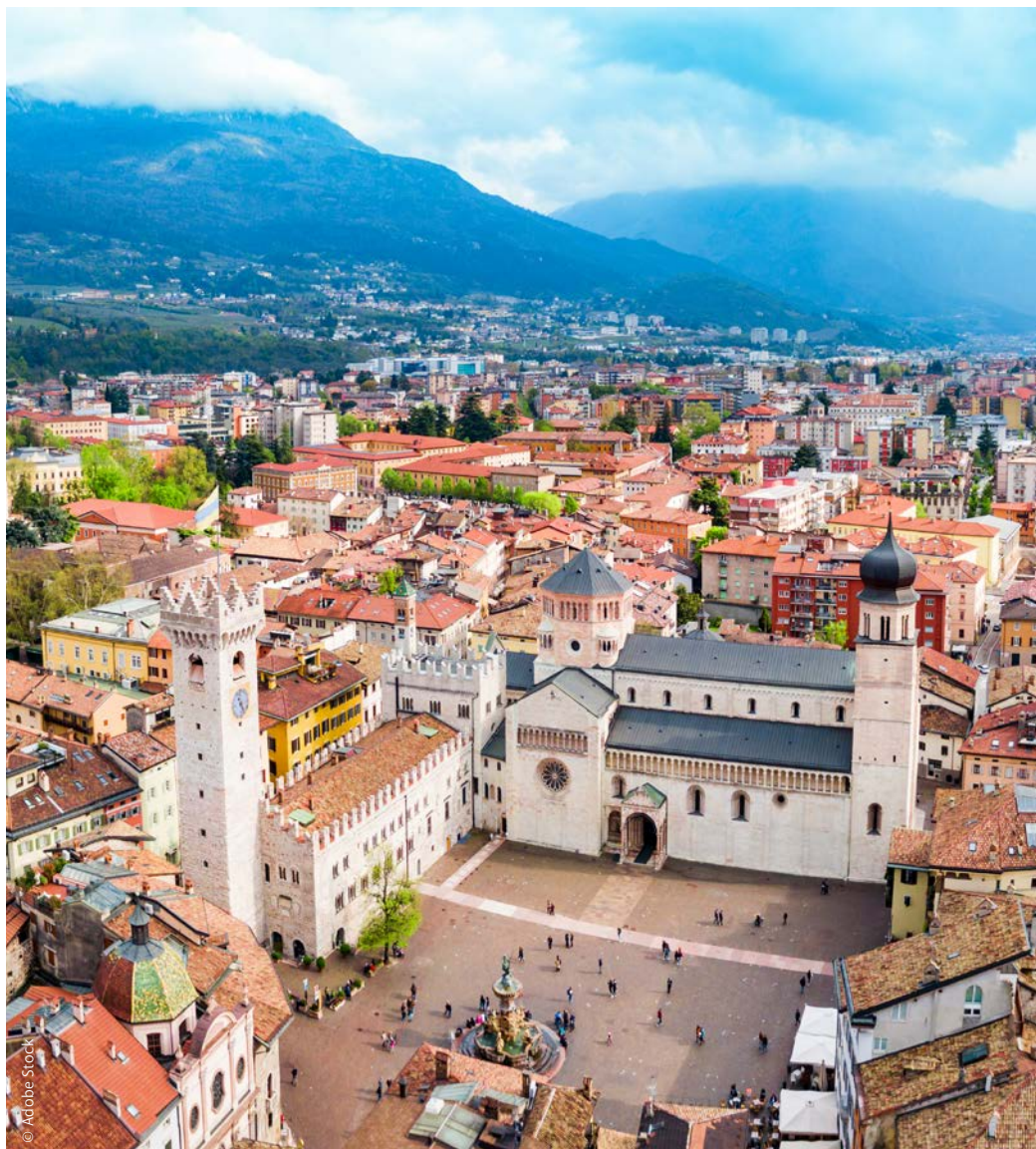
Trient bietet ein vielfältiges Angebot für Erwachsene wie Kinder. Trento è ricca di offerte e proposte per adulti e bambini.

Aufgrund ihrer Vielfalt ist Trient zu jeder Jahreszeit sehenswert. Im Winter locken die zahlreichen Skigebiete, aber auch die Weihnachtsmärkte