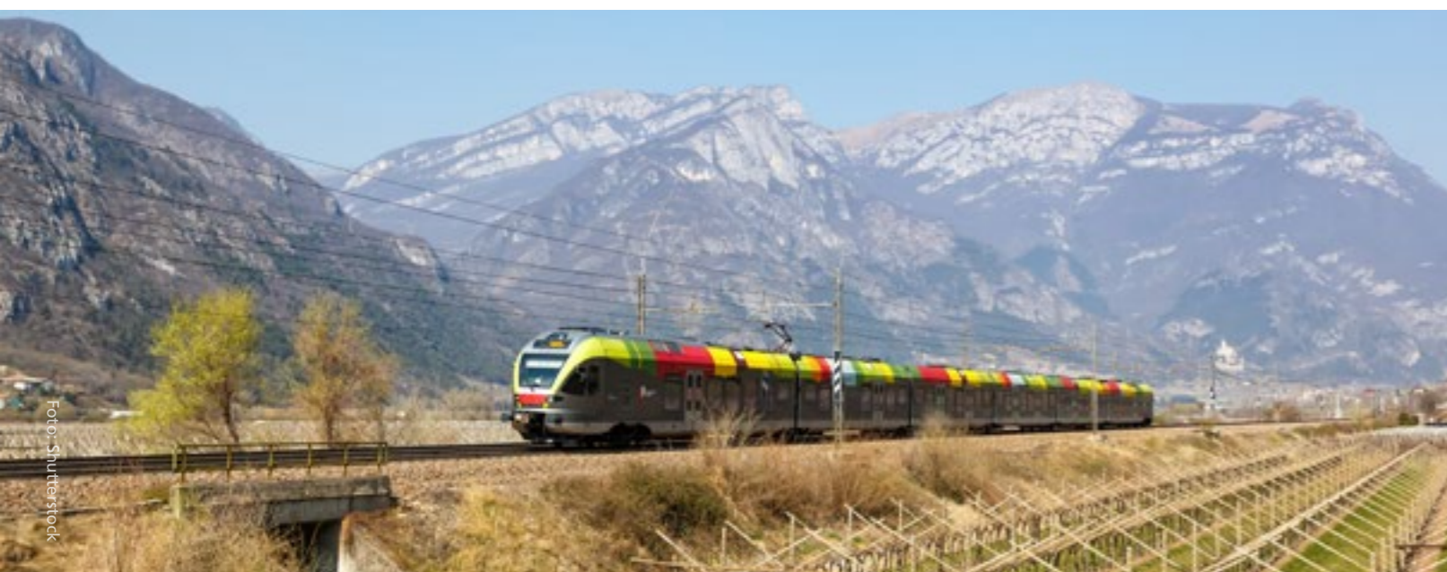
Mit den öffentlichen Verkehrsmitteln können Familienausflüge in der gesamten Euregio unternommen werden. // I trasporti pubblici possono essere utilizzati per le gite in famiglia in tutta l'Euregio.